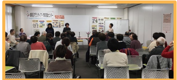
朗読発表会の様子

<お問合せ先> 鶴見区ボランティア・市民活動センター (電話:06-6913-7070)