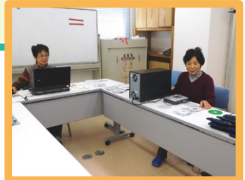
録音編集やダビング作業