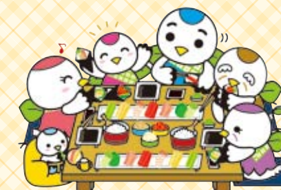
鶴見区マスコットキャラクター「つるりっぷ」

このサービスは地域社会福祉協議会が中心となり、各地域のボランティアさんたちが、ひとり暮らしの高齢者、高齢者世帯または寝たきりの高齢者の方々に配食や会食を行うことによって人々とのふれあいを深め、閉じこもりを予防し健康の増進を図ることなどを目的に活動しています。また日頃から研修会や講習会を実施し、参加された方々に安全に楽しく食事をしていただけるようにも心がけています。