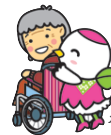
鶴見区マスコットキャラクター 「つるりっぴ」